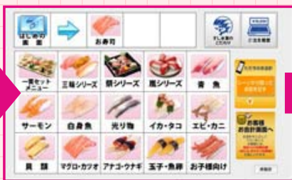
▲詳細カテゴリーを選択