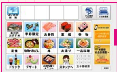
▲カテゴリーを選択