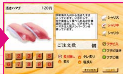
▲注文数を入力する。

本日のおすすめ、季節限定、お寿司、軍艦、巻物、デザートなどのカテゴリーが表示され、お好みのカテゴリーから選択して注文することができます。